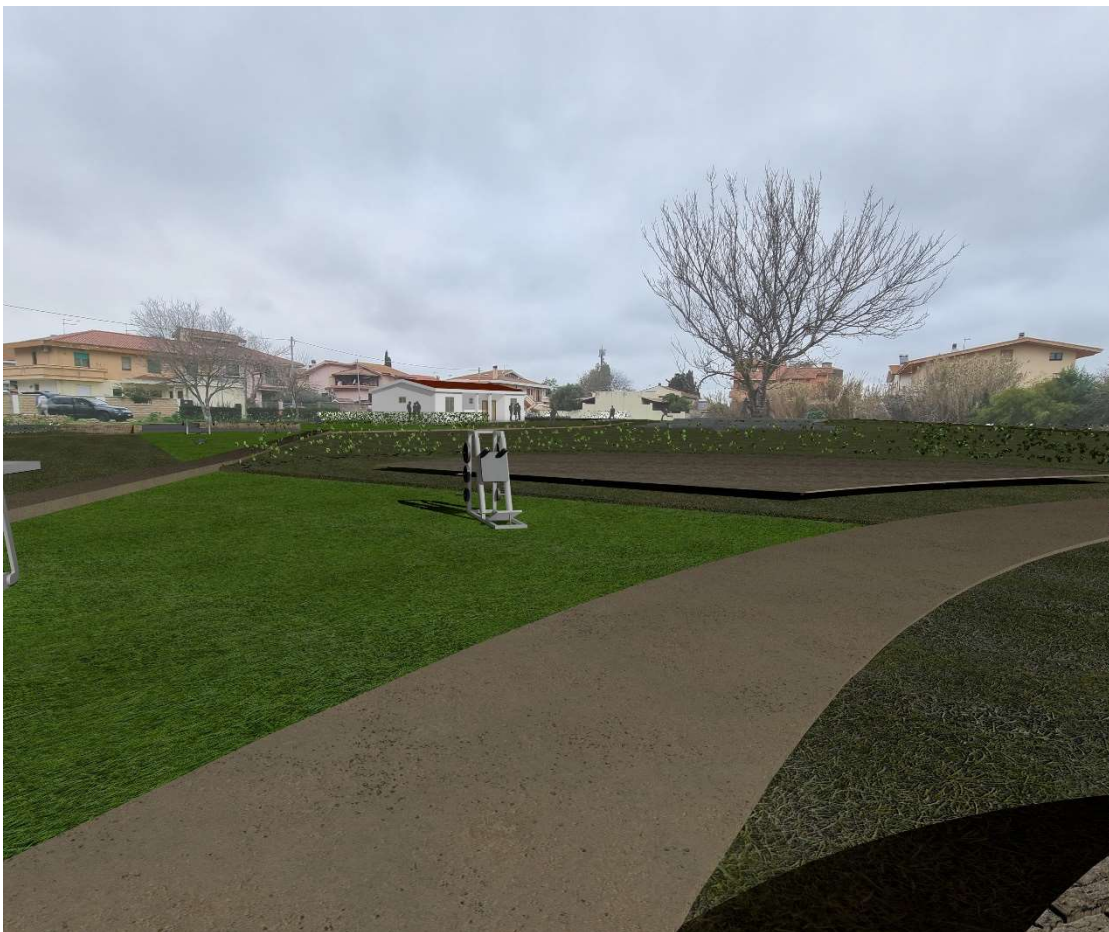
4 - Vista lato nord-est - progetto