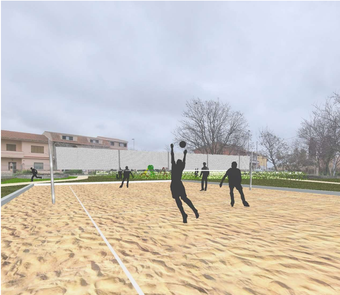
5 - Vista lato sud - progetto