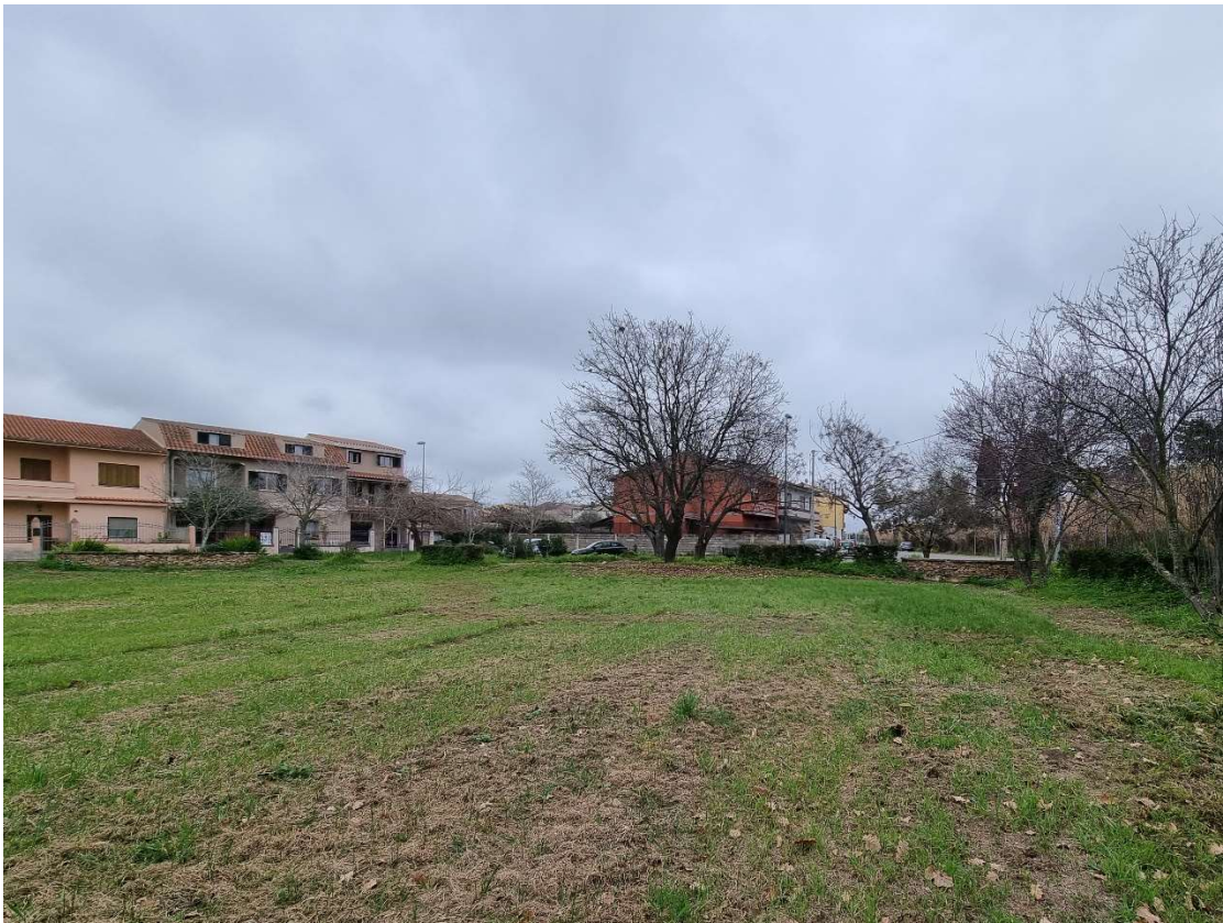
5 - Vista lato sud - stato di fatto