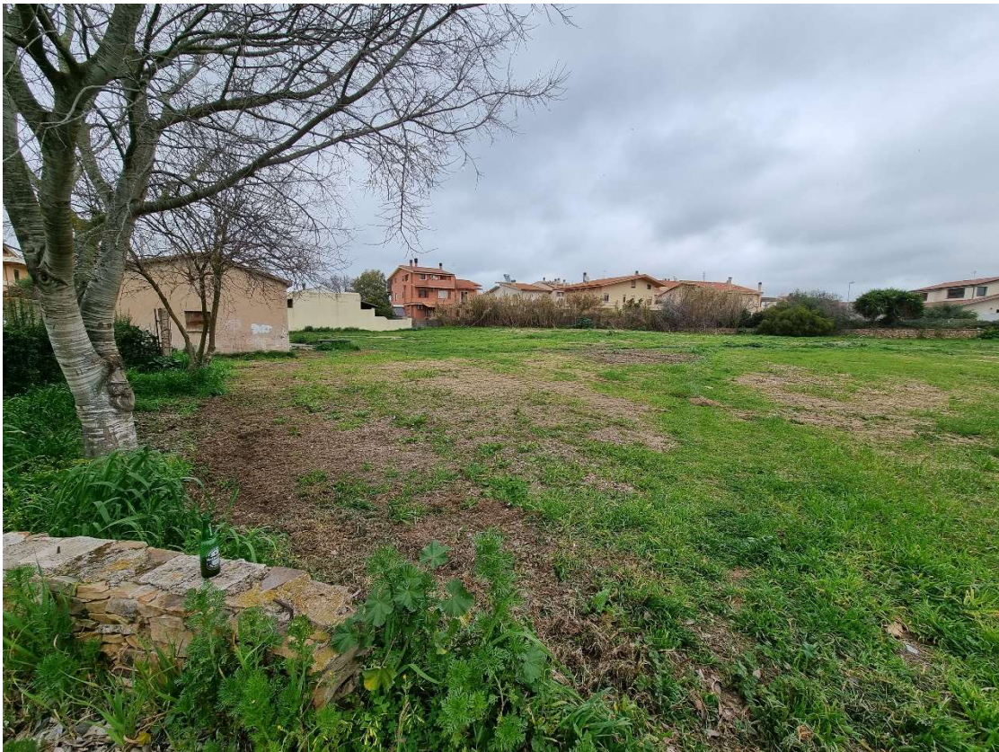
3 - Vista lato nord stato di fatto