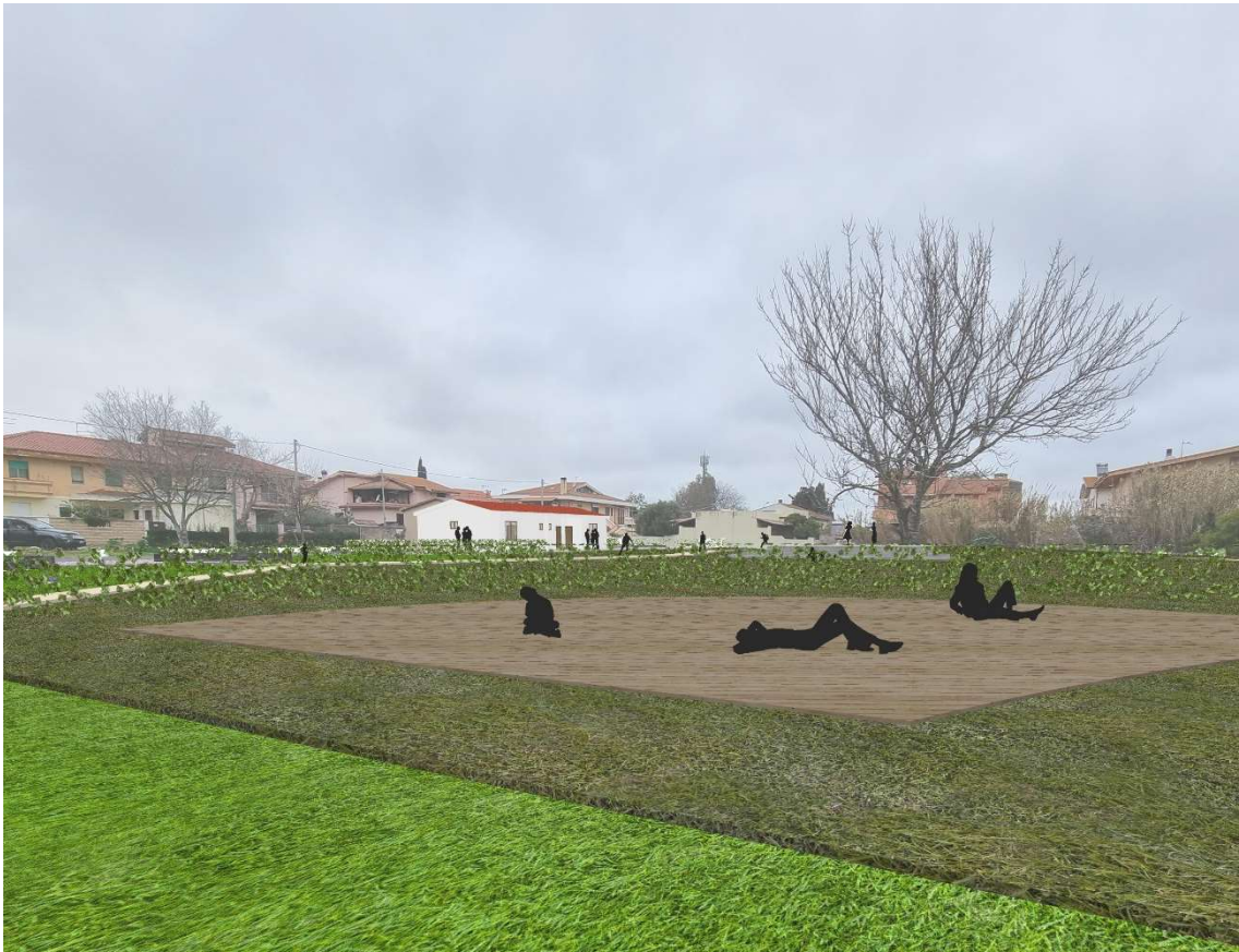
2 - Vista lato nord progetto