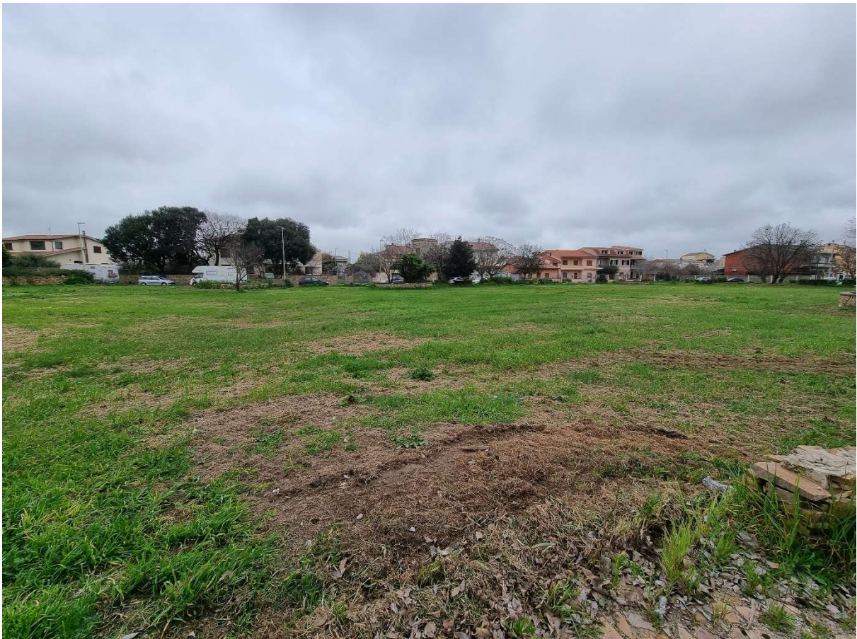
Vista lato est