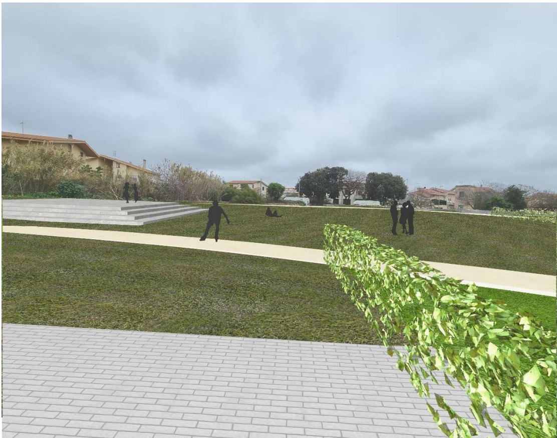
1 - Vista lato nord progetto