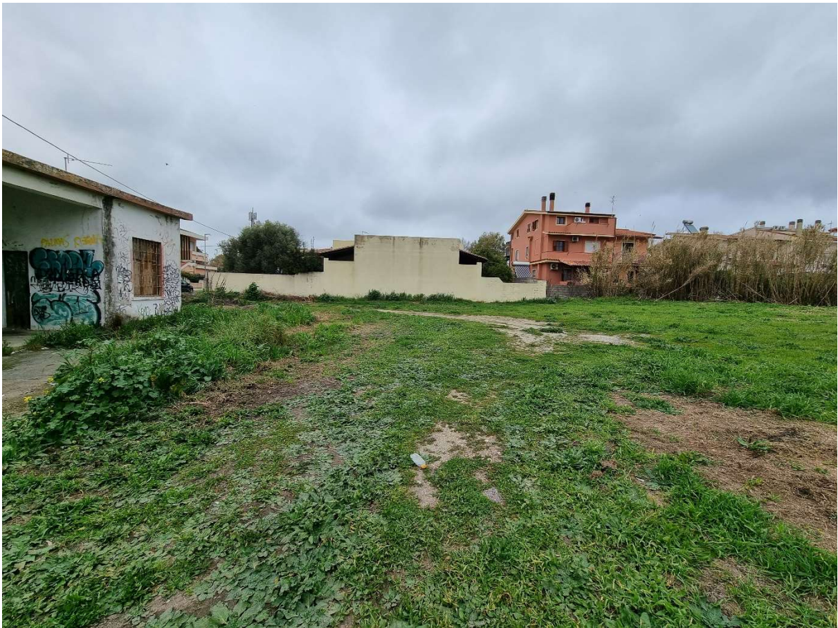
Vista lato nord – edificio ex spogliatoi