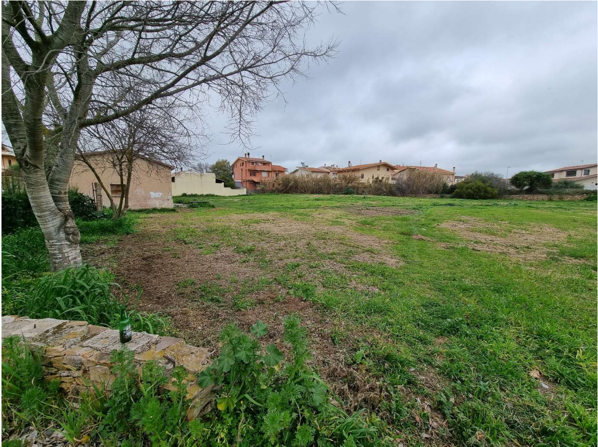
Vista lato Nord