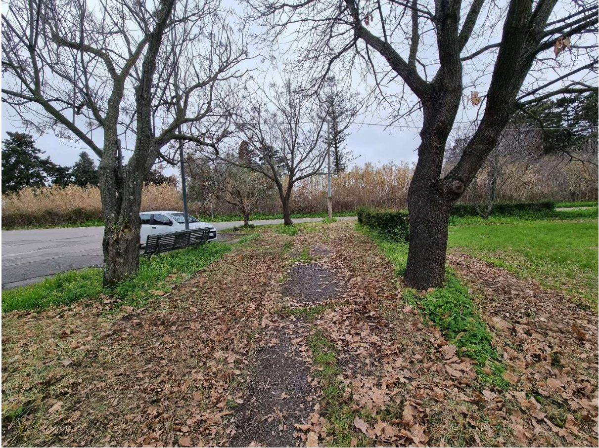
Vista lato sud - Parcheggio