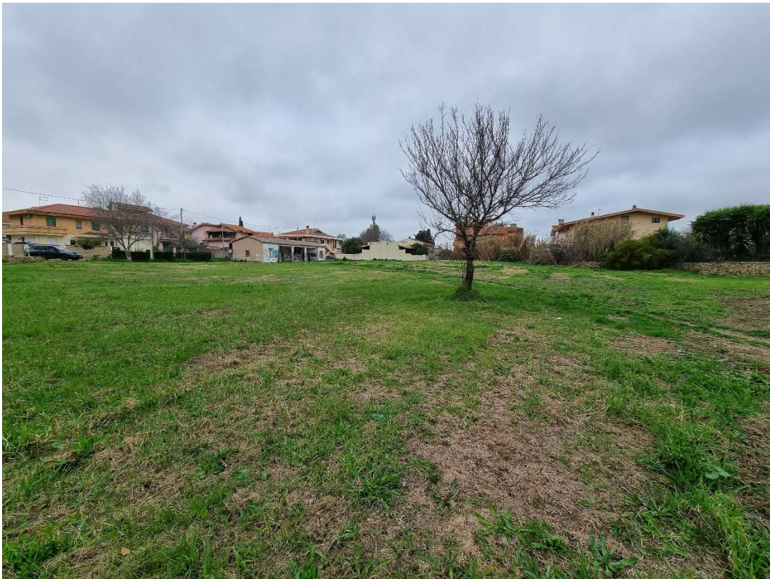
2 - Vista lato nord stato di fatto