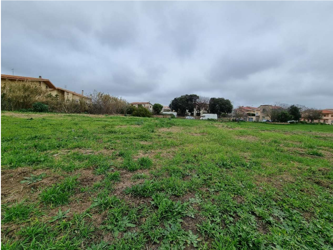
1 - Vista lato nord stato di fatto