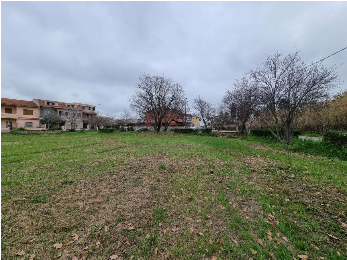
Vista lato sud