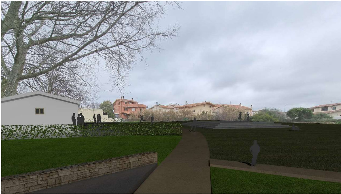
3 - Vista lato nord progetto