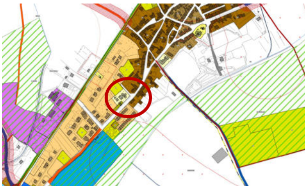
stralcio PUC - zona S1

La planimetria mostra un'articolazione architettonica dell'edificio in due blocchi che coprono una superficie totale di mq 350,00: a sinistra un corpo parallelepipedo a due piani contenente uffici e aree di servizio e a destra la zona destinata alle aule che si sviluppa a piano terra, costituita da tre grandi stanze ottagonali connesse tra loro dall'ala centrale dei servizi.