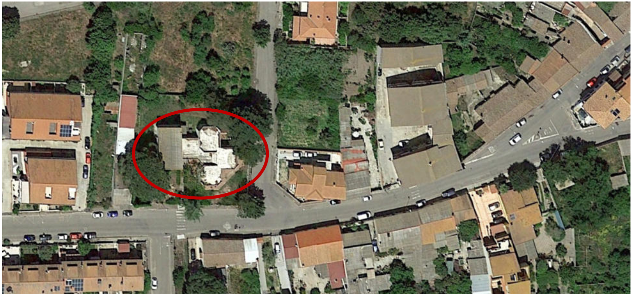
ortofoto - fonte Google Earth.

Il lotto di mq 1495 si attesta lungo la via Carlo Emanuele con un fronte di m 40,00 , e su via Logudoro per metri 38. All'interno del lotto si colloca l'edificio adibito sin dalla sua costruzione a scuola primaria.