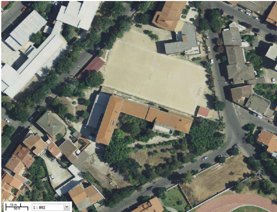
Vista Aerea dell'Edificio dalla forma ad Elle Rovescia.

Nel 2021 parte dell'edificio il corpo A sul lato lungo é stato ristrutturato per accogliere la Scuola Secondaria di primo grado Grazia Deledda. Il corpo B più corto è oggetto d'intervento ed inserito nell'intervento del PNRR Missione 4 .