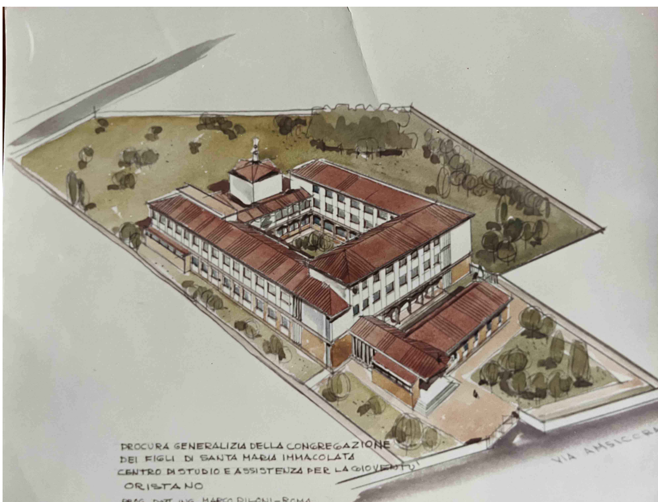
Vista Prospettica dell'Edificio come inizialmente progettato dall'Ing. M. Piloni di Roma

Il progetto Originario venne commissionato allo Studio Dell'ingegnere Marco Piloni di Roma prevedeva un complesso a quadrilatero con anche una Chiesa al suo interno di questo progetto venne però realizzato solo l'edificio dalla forma ad elle attuale.