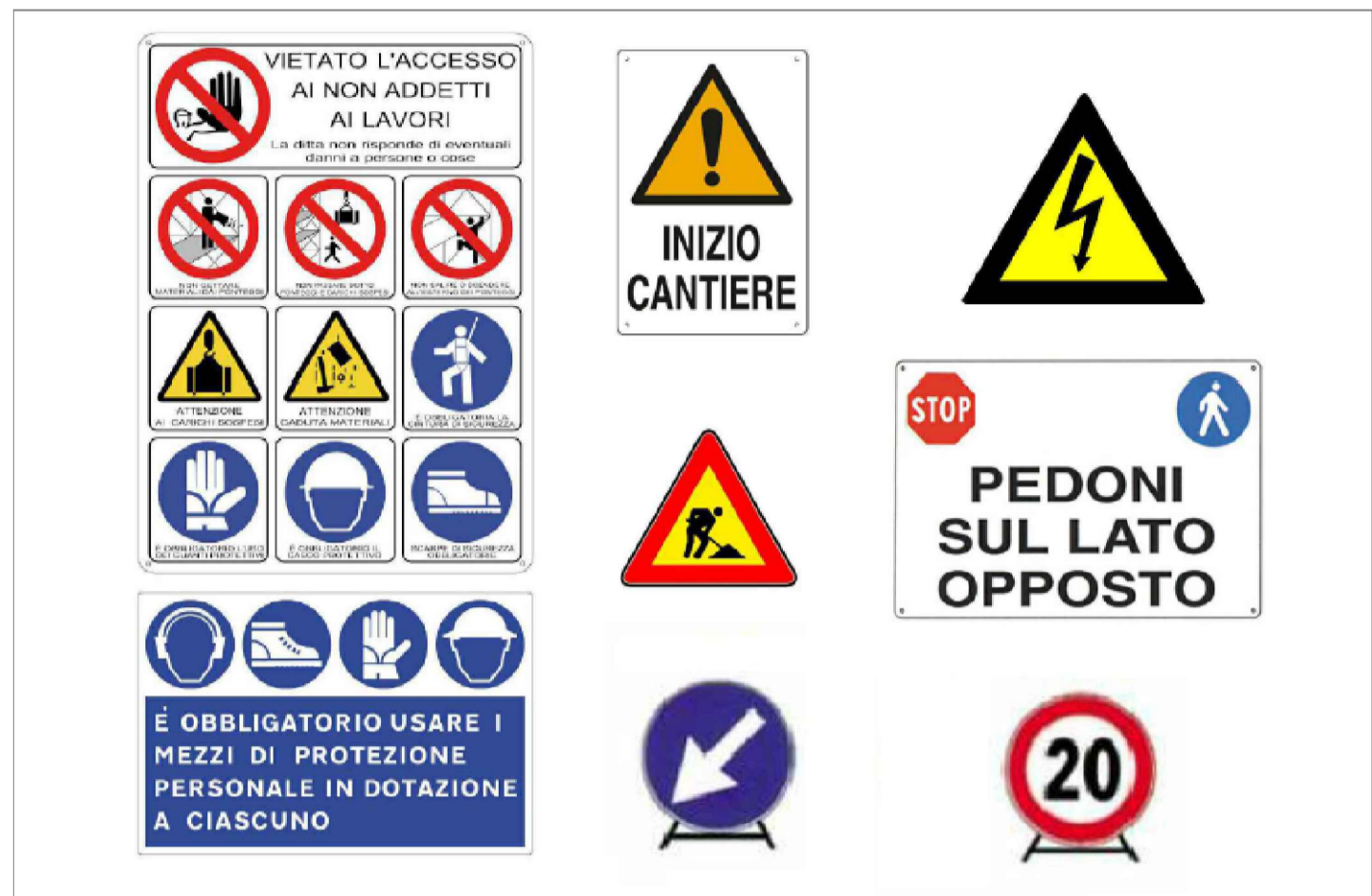
CARTELLONISTICA DI CANTIERE