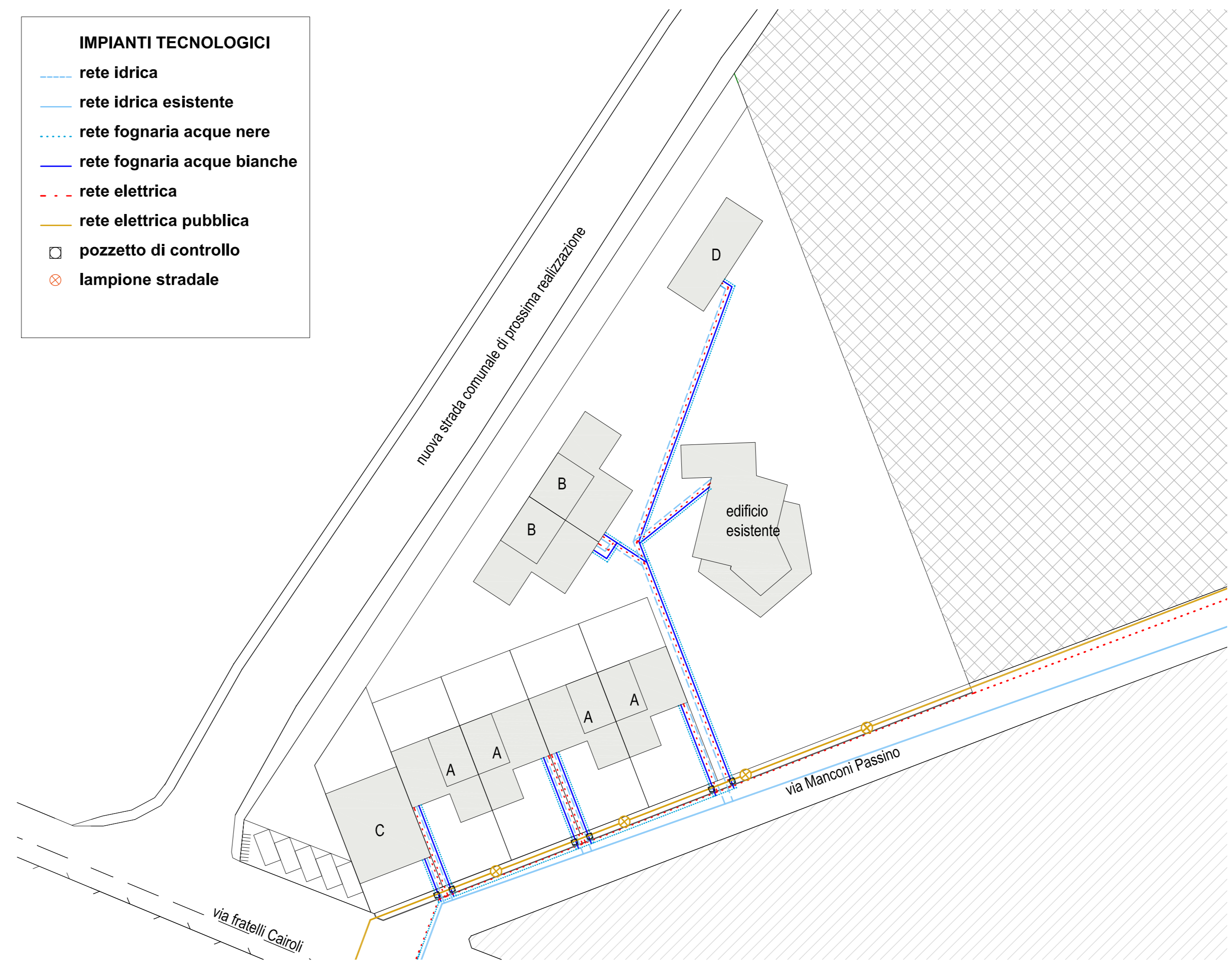
impianti tecnologici sc 1:500